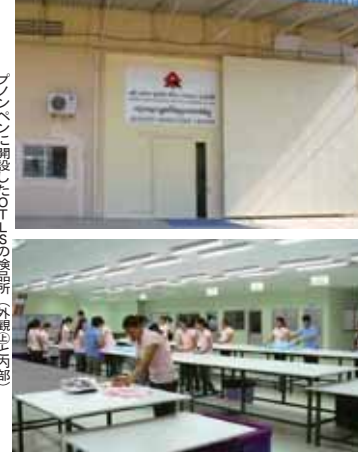
カンボジアに開設したOTLSの検品所(左)と倉庫(右)の様子

同社は昨年10月、現地の L.S. を設立。10月から事業を開始した。出資比率は、L.S. が70%、T.S. が30%。OTLSは、国際貿易取引の現地コンサルタントとして、同社の代理業務をサポートする。OTLSは、同社の代理業務をサポートする。OTLSは、同社の代理業務をサポートする。